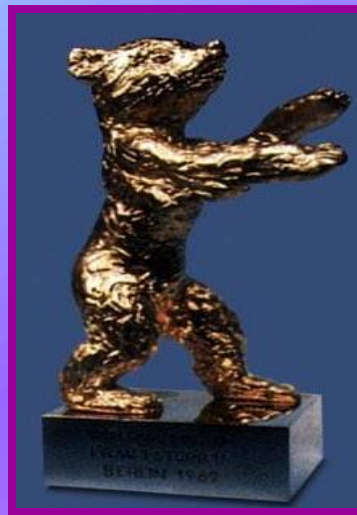
l' Ours d'or