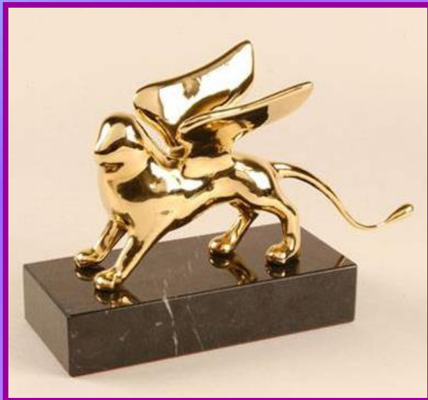
le Lion d'or