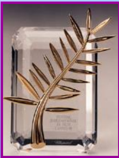
la Palme d'or