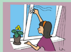
Часто проветривайте комнату