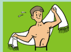
Закаляйтесь! Предупреждайте заболевания!