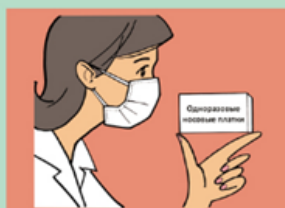
Используйте маски и одноразовые носовые платки