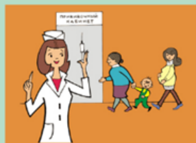
Своевременно вакцинируйтесь, беременные – с 14-ой недели