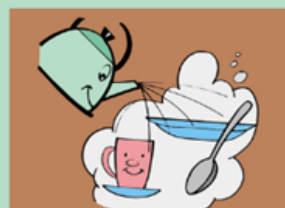
Выделите посуду больному