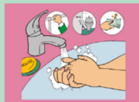
Регулярно мойте руки