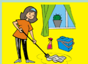
Ежедневно проводите влажную уборку