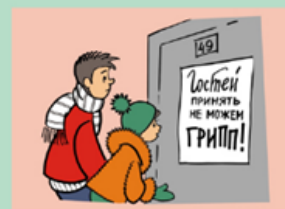
Ограничьте посещения массовых мероприятий